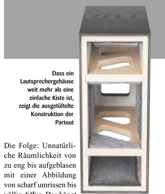
Dass ein Lautsprechergehäuse weit mehr als eine einfache Kiste ist, zeigt die ausgetüftelte Konstruktion der Partout

Der ideale Lautsprecher wäre eine Punkt-schallquelle. Also im Grunde das in der Funktion umgekehrte Aufnahmefunktion: Ein Breitbandlautsprecher von maximal 25 Millimeter Durchmesser, der in der Lage ist, das gesamte Frequenzspektrum zu übertragen. Gibt es aber nicht. Breitbandlautsprecher, also Einwegsysteme ohne Frequenzweichen, kommen diesem Ideal am nächsten, haben aber bei größeren Durchmessern ungünstige Abstrahlcharakteristika wegen der Schallbündelung im Hochtonbereich. Vergleichbar mit Licht aus einer Taschenlampe. Kleinere Membranen mit weniger Problemen in dieser Disziplin lassen aber die Basswiedergabe außen vor. Entwicklungsziel war also, das Frequenzband in zwei Bereiche aufzutrennen, ohne den Vorteil eines zentralen Schallentstehungsortes aufgeben zu müssen. Dezentrale Systeme sind nämlich, je nach Hörposition, in puncto Summenbildung stark benachteiligt. Soll heißen, das vor den Wandlern elektrisch getrennte Signal, wird akustisch nicht wieder korrekt zusammengesetzt, oder aber unter jedem Hörwinkel mit anderen Zeitbezügen und unterschiedlichen Frequenzgängen.