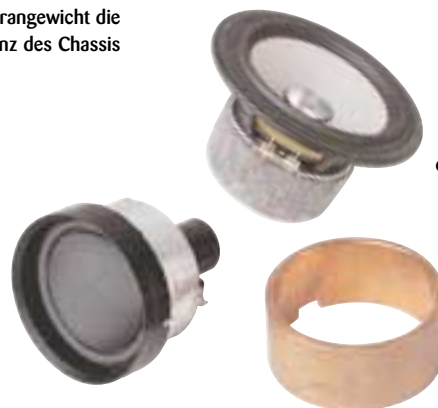
Die Summe der Teile: Für die Einhaltung elektroakustischer Parameter muss jedes Einzelteil präzise gefertigt sein