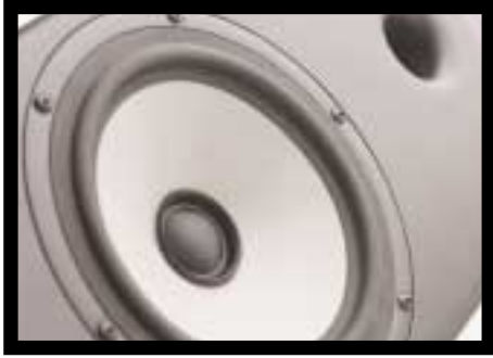
Was auf den ersten Blick wie ein reiner Tieftöner aussieht, entpuppt sich bei genauerer Betrachtung als vollwertiges Zweiweg-Chassis

Zwei Jahre Entwicklungsarbeit stecken im neuen Schallwandler. Ein überdurchschnittlicher Zeitaufwand für die erfahrene Mannschaft. Der ursprüngliche Gedanke, einen reinen Centerlautsprecher zu konstruieren, welcher sich mit den anderen Audiodata-Modellen verträgt, wurde schnell verworfen. Denn das hohe klangliche Niveau der Geschwister Filou, Echelle II, Elance II und der gigantischen Sculpture sollte auch in Mehrkanalanwendungen zum Tragen kommen. Erste Entscheidung war die Entwicklung eines vollkommenen neuen Chassis. In Zusammenarbeit mit der norwegischen Firma Seas entstand ein Dual-Koaxial-Treiber. Zweite Verfügung war, dass der Lautsprecher sowohl bei Heimkinos als auch bei reiner Musikwiedergabe überdurchschnittlich aufspielen soll. Das Ergebnis