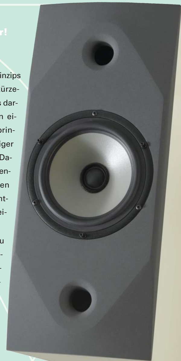
Partout in Ahorn, Schallwand titan, auf Ständer 60 cm, titan.

Partout kann mit Petite und Carré zu einer überzeugenden und musikalisch „wie aus einem Guss“ aufspielenden Gesamtanlage kombiniert werden.