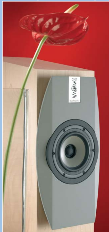
Die Ambiance – ein Blickfang in jedem Wohnraum.

Letztendlich dient unser Engagement nur einem Zweck: Ihnen Musik mit ihrem ganzen Klangspektrum zu vermitteln, ohne dabei auf Wohnkultur zu verzichten.